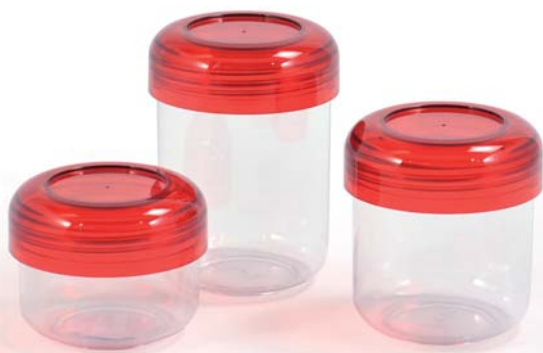
Bally-sarja on tullut uudelleen myyntiin.

Saatavilla on kolme eri kokoa: 0.5, 0.75 ja 1 litran astiat. Väri vaihtoehtoina ovat transparenttivärit punainen ja savu. Lisäksi tilauksesta on saatavana yksilöllisiä erikoissarjoja, jotka voidaan varustaa myös painatuksella. Kysy lisää korkealuokkaisista Bally-astioista!