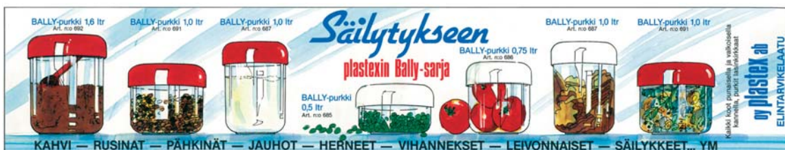
Ballyja esiteltiin aikoinaan tähän tyyliin. Kuvassa Bally-purkin panta 1970-luvulta.