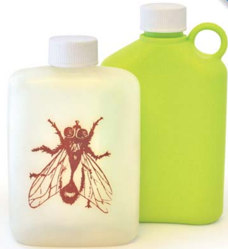
Taskumatti on eräs Plastexin tunnetuimmista ja perinteisimmistä tuotteista, joka on pitänyt pintansa nykypäivään asti.