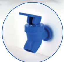
Vesiastian kansi ja hana on uudistettu entistä käyttäjäystävällisemmiksi.