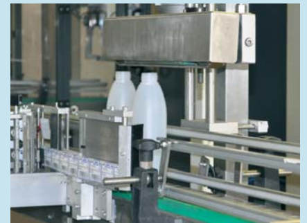
Nykyisin vastaavat työsuoritukset tehdään konevoimin. Kuva automatisoidusta tuotantolinjasta 2000-luvulta.