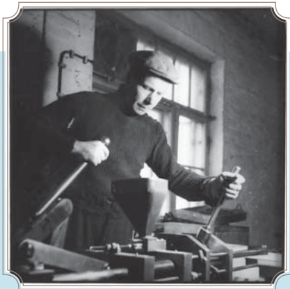
Aikoinaan muovin ruiskupuristustyötä tehtiin käsivoimin. Kuva Plastexin tehtaalta 1950-luvulta.

Plastex tuo lohtua monille nuoremmille yrityksille osoittamalla että on täysin mahdollista toimia pitkään ja onnistuneesti. Plastex onkin tänä päivänä johtava suomalainen ruiskuvalu- sekä puhallusmuovattujen muovituotteiden valmistaja ja toimittaja, jonka asiakkaina ovat Suomen suurimmat vähittäiskaupan keskusliikkeet sekä muovipakkauksia käyttävä teollisuus. Lisäksi yrityksellä on laajaa teknistä sopimusvalmistusta useille asiakkaille.